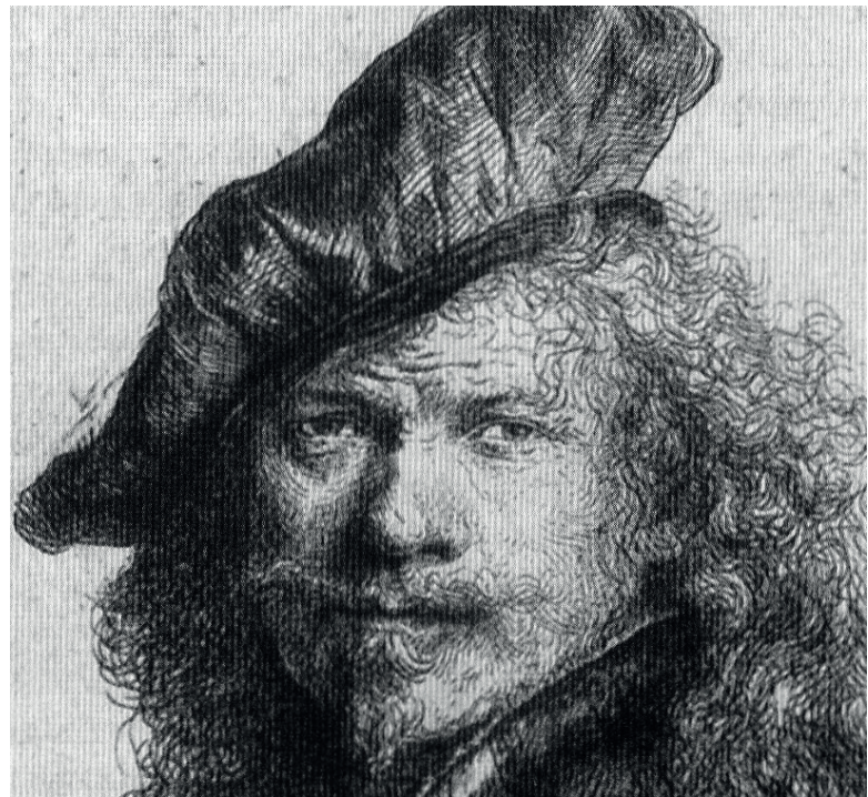
Figura 3: Autorretrato apoyado sobre un muro de piedra, aguafuerte, 1639 (detalle).

En el grabado, otro pilar fundamental en la actividad de Rembrandt, se duplica la inversión, ya que se realiza sobre una plancha metálica de la que a su vez se obtiene una copia invertida en papel (la doble inversión deja el estrabismo en el ojo real) (8). El estrabismo también explica porque en muchas ocasiones Rembrandt oculta en sombra o con el pelo la mitad del rostro y, a donde aparece mirando hacia la izquierda para disminuir el ángulo de desviación (9) (fig. 4) a menudo, ofrece una