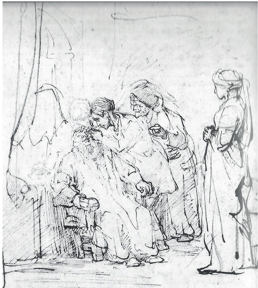
Figura 2: La curación del ciego Tobit, 1645.

Existen varias versiones similares repartidas por diferentes museos con pequeñas variaciones (5,7).