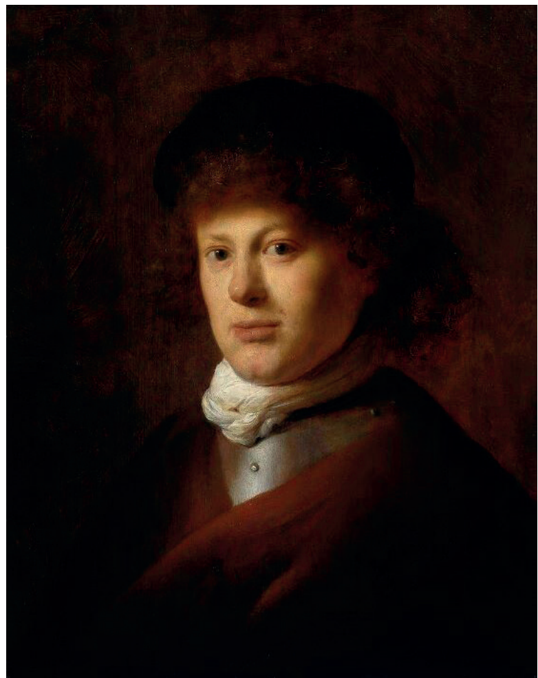
Figura 4: Retrato de Rembrandt, de Jan Lievens, 1629.