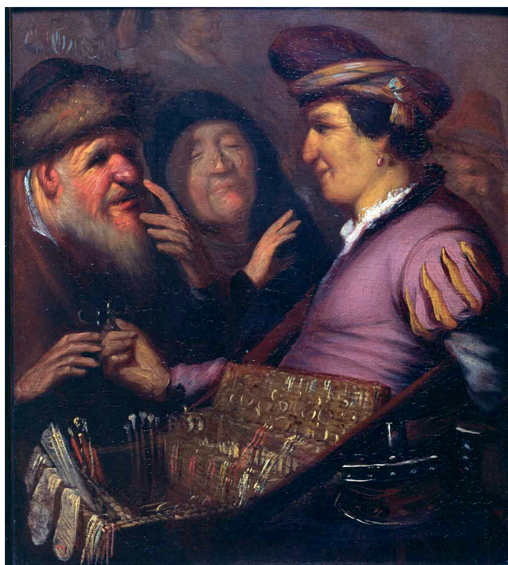
Figura 1: La alegoría de la vista (El vendedor de gafas), 1625.

El cuadro coincide cronológicamente con la célebre publicación de Benito Daza Valdés “ El uso de los antojos para todo género de vistas ”,