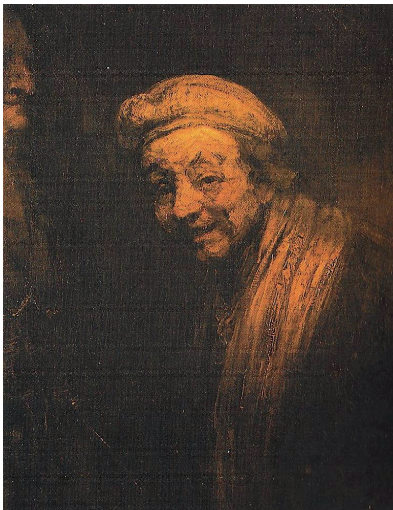
Figura 5: Autorretrato caracterizado como Demócrito, 1669.

Finalmente, un recorrido por sus últimas obras (vivió hasta los 63 años) nos hace pensar que había desarrollado cataratas ya que en estos lienzos su estilo había virado hacia un estilo tosco, de pinceladas imprecisas y contornos menos marcados dentro de una tonalidad neblinosa y marrónácea, parecida a la documentada en Monet cuando padecía cataratas avanzadas (10) (fig. 5).